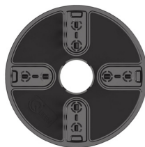
KOPF Q2 Ø 130 mm QP2 Ø 114,5 mm